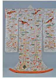
18〜20世紀の着物も展示

今年で25周年を迎えた フラワースクール「アト リエオルタンシア」。9 月27日(木)〜29日(土) の期間、展示会「雅とモ ダンデザインの出会い」 を開催。18〜20世紀の着 物5点や、帯などからイ ンスパイアされた花のデ ザインをスキャンジナレ アのモダンデザインの器に 生けて、会場内をディスプレイ します。「かつて 19世紀末ジャポニスムが