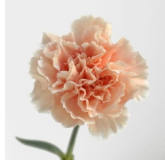
ドヌーブ かわいいピーチ色。定番♪