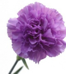
ムーンダスト 『ライラックブルー』